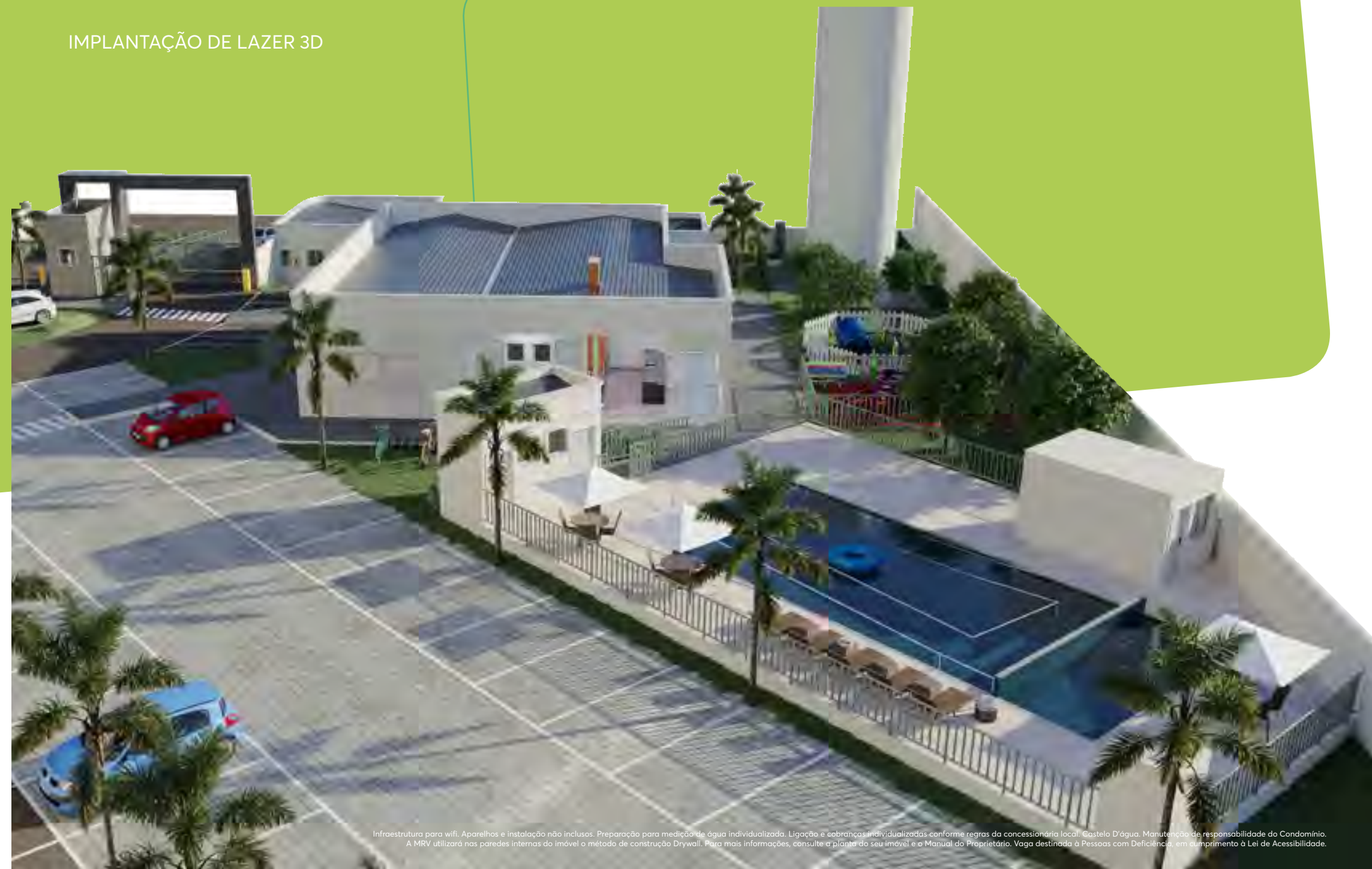
IMPLANTAÇÃO DE LAZER 3D

Imagem ilustrativa com sugestão de decoração. Os móveis, objetos, revestimentos e demais acabamentos não fazem parte do Contrato. O empreendimento e suas unidades serão entregues conforme Memorial Descritivo. A MRV utilizará nas paredes internas do imóvel o método de construção Drywall. Para mais informações, consulte a planta do seu imóvel e o Manual do Proprietário.