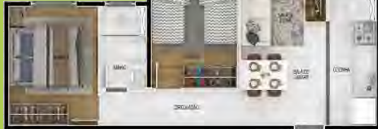
APTO. 204 | TORRE 1