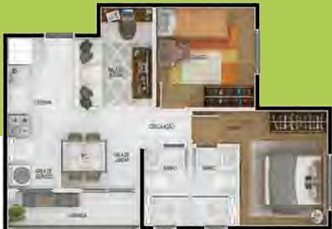
APTO. 201 | TORRE 1